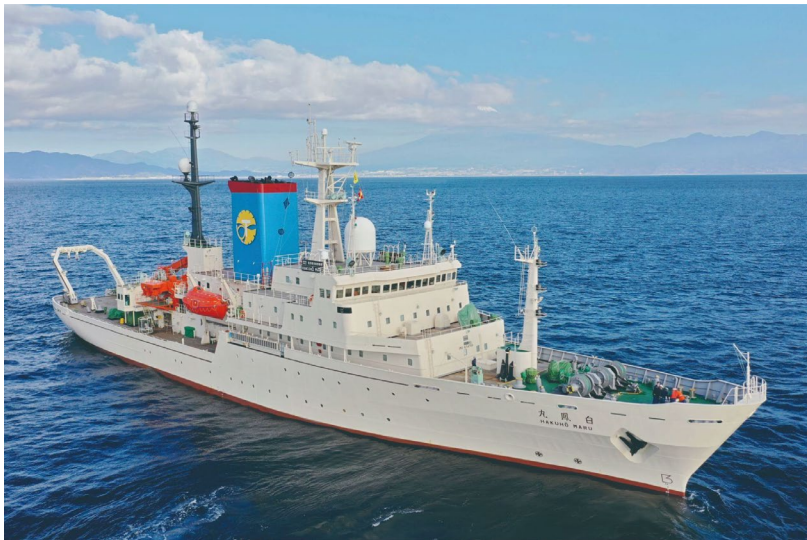
(写真1) 学術研究船「白鳳丸」

※2 海底電位磁力計 (OBEM: Ocean Bottom Electromagnetometer) : 海底地震計と同様、船舶により海底に設置し、一定期間磁場及び電場を測定する。取得した磁場及び電場データから海底下の電気の流れやすさを可視化し、流体の分布を把握することができる。