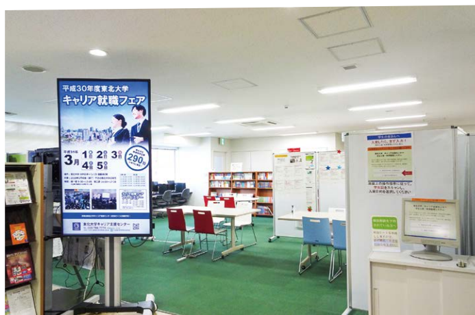
川内北キャンパス 教育・学生総合支援センター3F キャリア支援センター