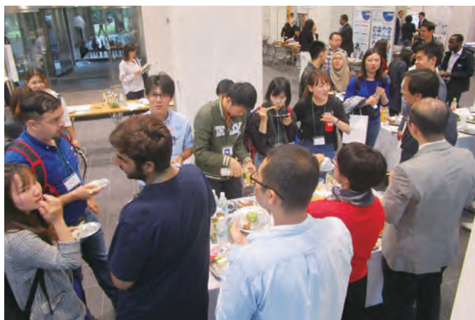
JETRO・グローバル人材と外資系企業のための交流会(2019年)

カリキュラムは東北大学の日本語特別課程科目ならびに全学教育科目を中心に構成されており、日本で働く際に求められる日本語でのコミュニケーション力や企業文化への理解などのスキル習得を段階的に促していきます。自身の研究スケジュールや希望に沿うように相談しながら履修スケジュールを立てることができ、課外セミナーも活用して計画的に就職活動の準備を進めることができます。日本で就職を考えている留学生の皆さん、東北イノベーション人材育成(DATEntre)プログラムに参加し、日本で働く夢を実現しませんか?随時参加可能ですので、興味のある方はお問合せください。