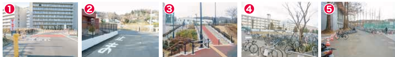
1 遊歩道との交差点です。必ず一時停止を行いましょ。

次の5箇所は歩行者や自動車との接触など危険箇所なので、通行するときに十分注意しましょう。