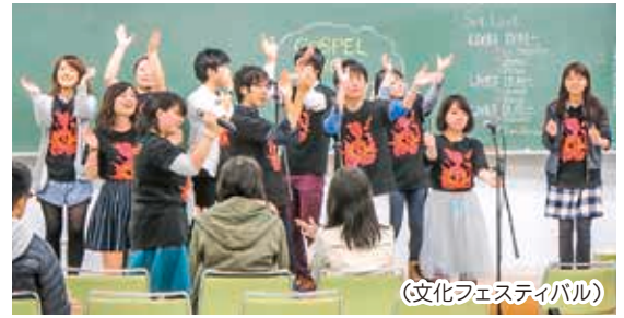
(文化フェスティバル)

新入学シーズンは、先輩方による学友会サークルの勧誘活動が繰り広げられ、いろいろな新入生歓迎行事が行われます。新生活を更り豊かなものにするためにもぜひ参加してみてください。