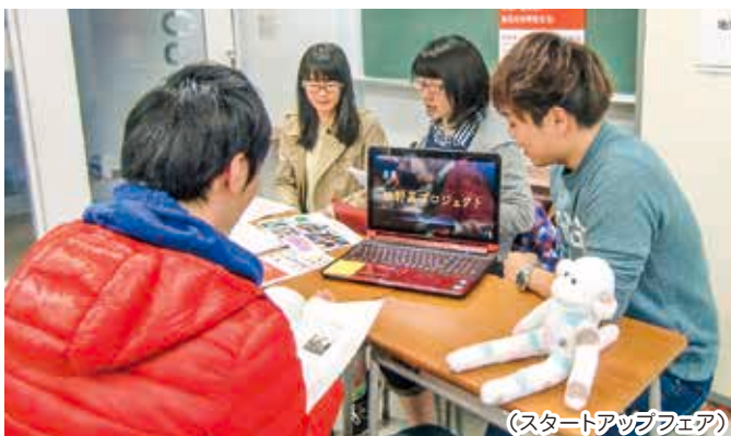
(スタートアップフェア)