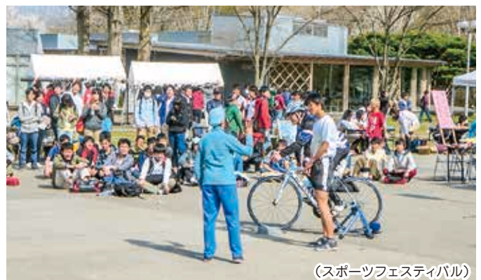
(スポーツフェスティバル)