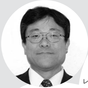
た どころ さとし 田所 諭

特に、不完全な素子を用いた場合でも量子暗号の安全性を定量的に保証する理論を構築し、量子暗号の実用化に向けて貢献しています。