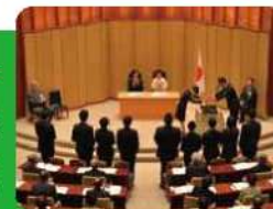
▲優秀な博士課程学生を表彰する「育英賞」

大学院の博士課程で学ぶ学生や博士課程を修了した若手研究者に研究奨励金を支給し、研究に専念できるように支援する特別研究員制度を運営。また、優秀な博士課程の学生を表彰するなど、研究者を育てるための取り組みを行っています。