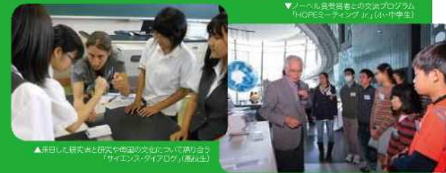
▲来日した研究者と研究や母国の文化について語り合う「サイエンス・タイアログ」(高校生)

日本学術振興会の招きで来日した世界各国の研究者と高校生が、研究のことだけでなく、それぞれの研究者が育った国のことなどについて、英語で語り合うプログラムを実施するほか、ノーベル賞受賞者と小中学生、高校生が交流するプログラムなどにより、小中高生が科学研究に対する好奇心を高め、国際的視野を広げる場を提供しています。