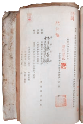
「西田の講演を伝える学内通知」（昭和10年）東北大学史料館所蔵 ※これまで明らかになっていなかった演題が書かれている。