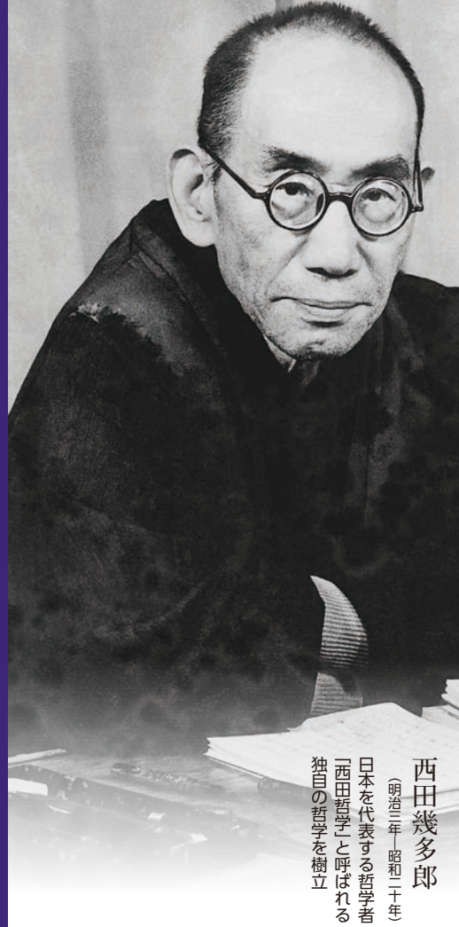
西田幾多郎 (明治三年―昭和二十年) 日本を代表する哲学者 「西田哲学」と呼ばれる 独自の哲学を樹立