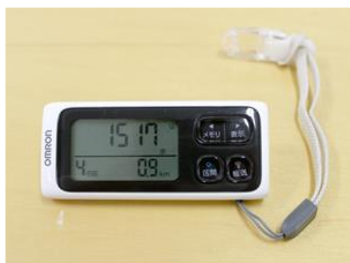
本調査にて使用した歩数計 (Omron Healthcare HJ-205IT)

今回、対象者の平均歩数、歩数計装着日数を算出し、また、疫学的手法にて、平均歩数と家屋の被害状況、年齢、性別、調査参加年度、調査参加月を関連付けて解析しました。