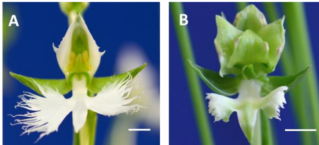
図 1. サギソウの花 野生型品種‘青葉’(A)および緑 花変異品種‘緑星’(B)