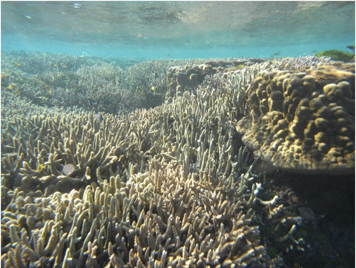
図3：光合成をする共生藻を棲息させているため、海面近くに生息する造礁サンゴ。現在のグレートバリアリーフのサンゴ礁の様子。