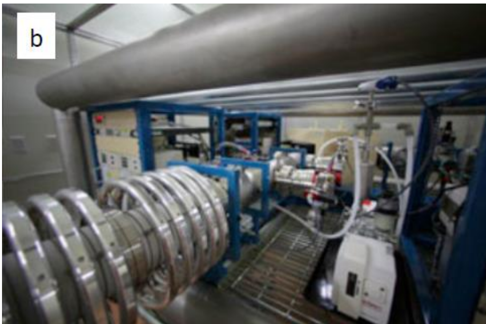
図 4： かつての海水準の時期を決定する放射性炭素年代測定を行う装置。 日本で唯一、東京大学大気海洋研究所にて稼働するシングルステージ加速器質量分析装置。 (a) 全景 (b) 加速器部分拡大