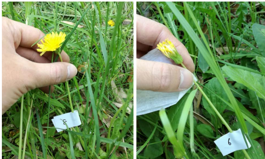
図1. 授粉していないタンポポ（左）と、授粉したタンポポ（右）。同日同時刻に撮影。

本研究成果は、2019年8月6日（火）（日本時間午前3時00分）に国際専門誌「Evolutionary Ecology」誌で公開されます。