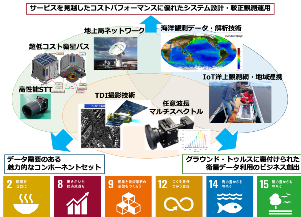
図 2:「個別の知」と「固有ノウハウ」を繋いだ本実証チームでつくる「輪」。

本実証チームは、この挑戦的な課題を、大学などに蓄積されている個別の知見と、産業界のプレーヤーが有する固有ノウハウとを融合・連動させることで解決する。アカデミックな研究は単独では社会との接点が少ないが、本プロジェクトでは、個別の研究成果を、ビジネスゾーンの各接点に明確に位置づけることで、ひとつの輪を形成し、人々の生活に還元する（図 2）。社会的価値を生み出すことにより、この「輪」から着実に利益を獲得し、その一部を適切に教育・研究に還元する持続可能な産学連携の仕組みづくりを目指す。