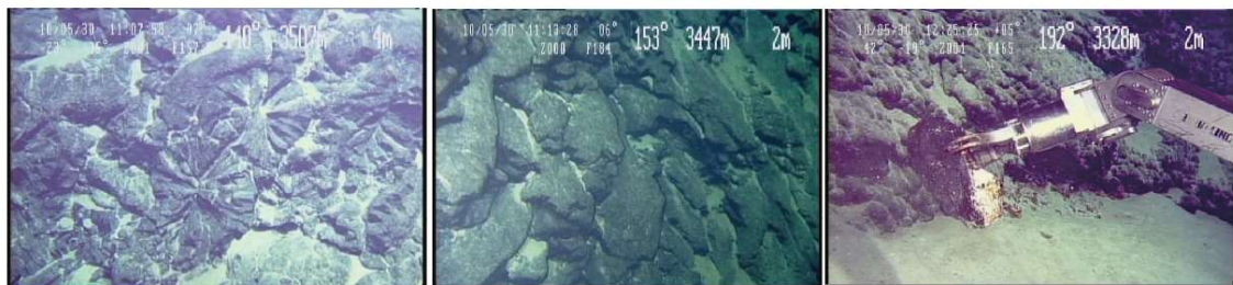
図 3. 有人潜水調査船「しんかい 6500」により撮影された海底の様子。マグマが海底を流出する際に作られる枕状溶岩が確認された。