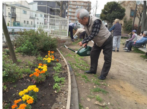
図 1. 足立リハビリテーションプログラム