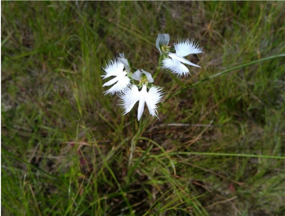
図1 サギソウの花の写真。