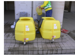
(上) 浄水設備の改善