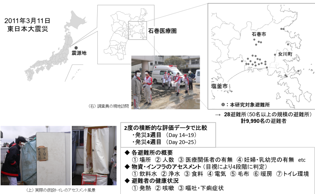
図 1. 東日本大震災後の石巻圏合同救護チームの活動概要と評価事項 本研究では、石巻圏合同救護チームが発災 3 週目と 4 週目に継続して訪問した避難所のうち、50 名以上の避難者からなる中規模以上の避難所で、かつ欠損データがなかった 28 か所の避難所のデータが検証されました。物資やインフラの評価は、訪問した調査員が実際に目視においてその人道的かつ衛生的なレベルを評価しました。