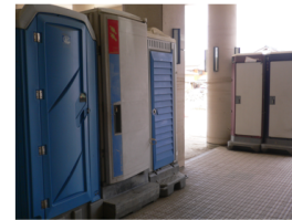
(上) トイレ環境の改善