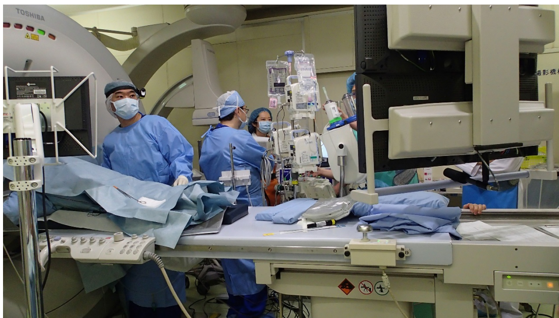
図2 治療の様子。CT透視下で治療を行う。