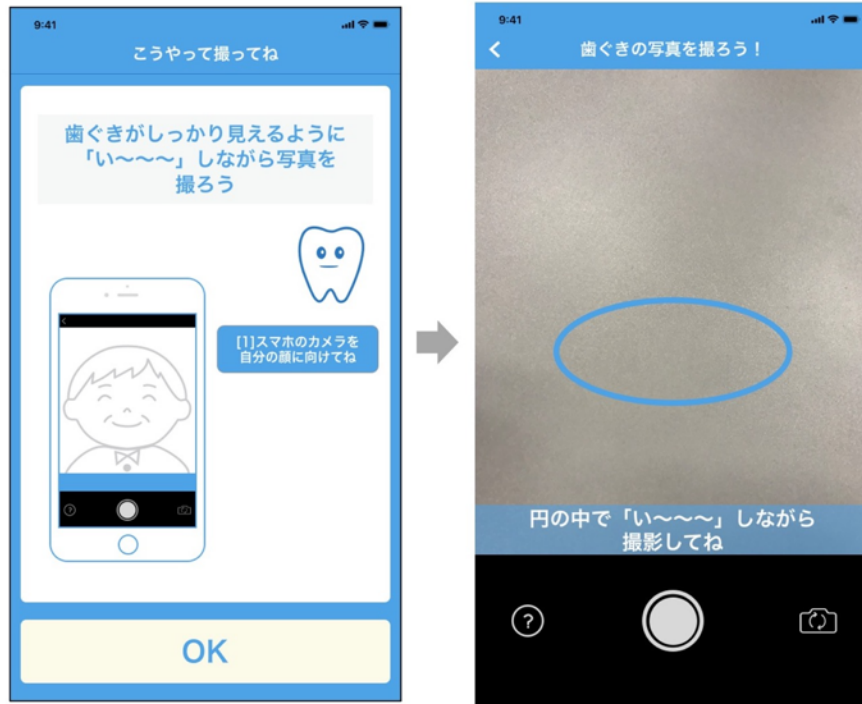
図1: 歯周病のリスクを推定する画面イメージ