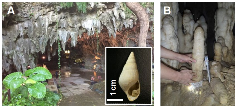
図 1. 沖縄本島南部のサキタリ洞遺跡と出土したカワニナ化石 (A)。同島南部の玉泉洞内で採取された石筍 (B)。