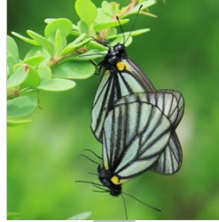
地域間の遺伝的な違いを推定