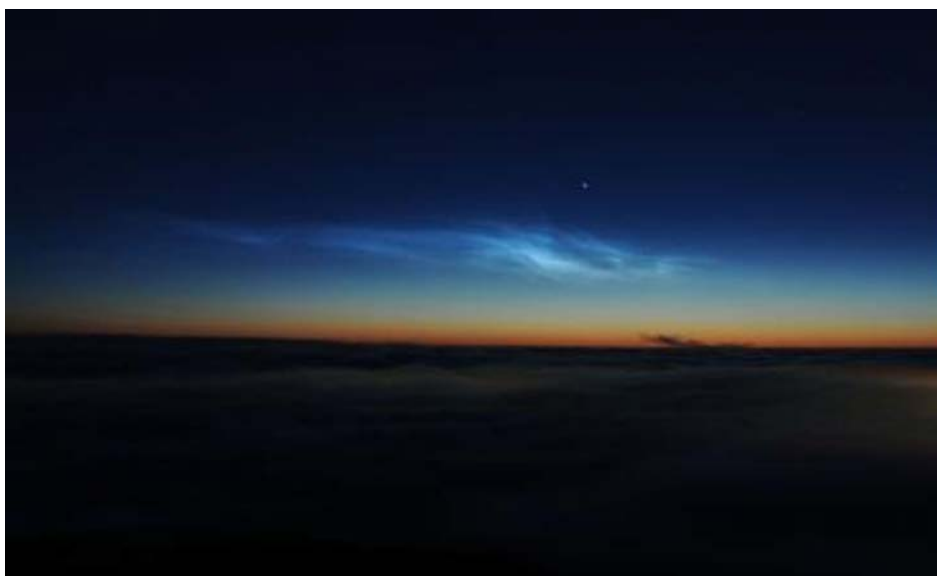
北海道大学低温科学研究所が紋別市のスカイタワーに設置したカメラで撮影した夜光雲

なお、本研究成果は、2022 年 4 月 28 日（木）公開の Atmospheric Chemistry and Physics 誌に掲載されました。