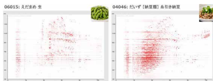
図 3: 生のダイズと、納豆に加工したダイズにおける成分プロファイルの変化