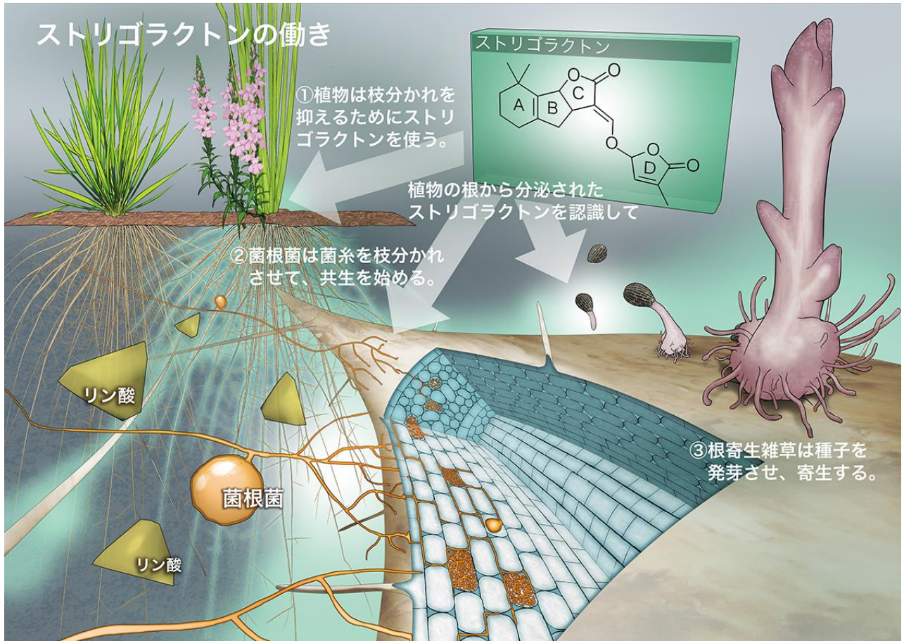
図1 ストリゴラクトンのはたらき

①植物体内でつくられたストリゴラクトンは自身の枝分かれ(脇芽の成長)を抑えるのに使われます。また、②土壌から吸収した栄養(主にリン酸)を植物に分け与えてくれる生物である菌根菌は、植物の根から分泌されたストリゴラクトンを認識して菌糸を枝分かれさせて、共生を始めます。一方で、③根寄生雑草(ストライガやオロバンキなど)は、ストリゴラクトンを認識して種子を発芽させ、根に寄生して栄養を奪います。