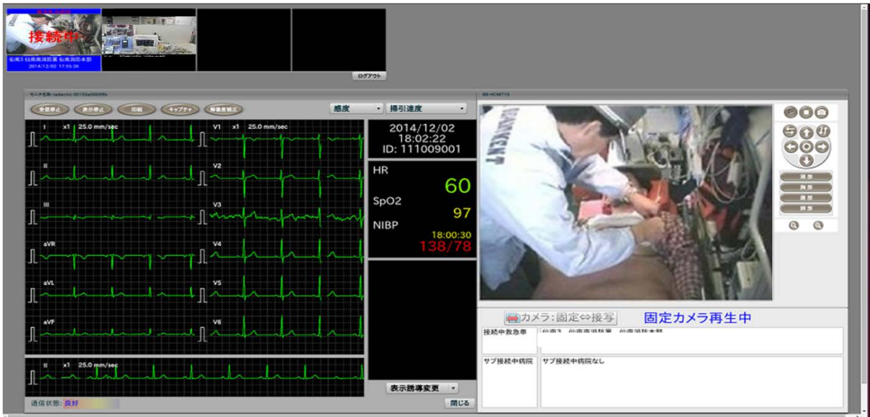
図2. 病院へ伝送された12誘導心電図と車内映像

12誘導心電図伝送システムの配備は、急速に全国的に広がっており、既に市内全救急隊への配備を完了した横浜市などでは、病院到着から治療までの時間が20～30分大幅に短縮されたと報告されています（図3）。