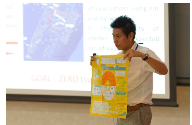
(Falling Walls Lab Sendai2014の様子)