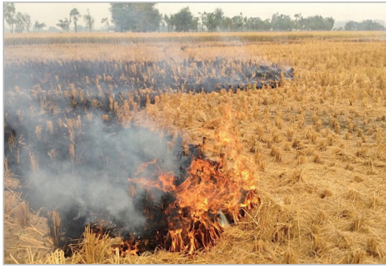
写真 1：パンジャブ地方の稲わら焼きの例（2018年11月4日撮影、林田佐智子）