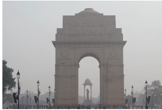
写真 2：PM 2.5 の高濃度時におけるデリー首都圏での視界不良の様子（2023年1月14日撮影）