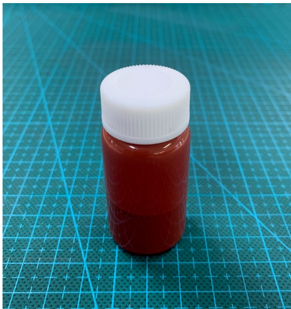
抗菌バイオマス系生分解性樹脂コーティング材、塗料

人口爆発に伴う気候変動や環境汚染などは深刻な問題であり、プラスチック汚染や海洋マイクロプラスチック汚染も生態系を破壊する壊滅的なレベルになりつつあります。特に COVID-19 の影響により、マスク、医療用防護服、手袋、フェイスシールドなどの石油系材料を用いるプラスチック製品が大量に生産され、消費されており、人々の意識が変化して、新型コロナウイルスがある程度終息したとしても今後もこの傾向は続くと思われます。使用済みのマスクなどが、新たな海洋プラスチック汚染の原因になりつつあるような報道もあり、いわゆるコロナごみの世界的な増加も懸念されています。また、これまでのプラスチック製品に抗菌性、抗ウイルス性を付加したような抗菌マスク、抗菌シールド、抗菌塗料などの製品も開発され、これらの製品の需要は今後もますます伸びてくることが予想されます。これらの製品群には石油系の樹脂材料などが主に原料として使用されていますが、これらの石化由来原料は石油由来のプラスチックと同じく、環境への負担が大きいのが問題です。このような問題に対して、GS アライアンスにおいては抗菌性を持つ天然バイオマス系生分解性樹脂製のプラスチック、コーティング材、塗料などの化学製品群を開発してきました。