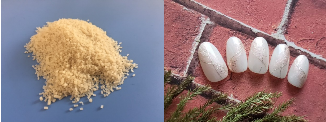
抗菌バイオマス系生分解性樹脂ペレット

GSアライアンス株式会社は抗菌性を持つ天然バイオマス系生分解性樹脂製のプラスチック、コーティング材、塗料などの化学製品群を開発し、サンプル販売を始めています。抗ウイルス性を持つ同製品も開発中です。これまでに抗菌性を持つ天然バイオマス系生分解性樹脂ペレット、それらの成形品であるネイルチップ、マスククリップ、カトラリー、そして抗菌性を持つ天然バイオマス系生分解性樹脂コーティング材、塗料なども開発してきました。