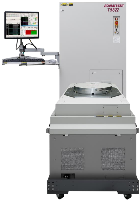
図1 本研究で STT-MRAM の評価に用いたアドバンテスト社製メモリテストシステム(T5822)。

磁石の性質を示す材料で構成された薄膜で、薄い絶縁層を挟んだ構造で構成される。二つの磁石の層の磁化の向きに応じて抵抗が変化するトンネル磁気抵抗効果を示す。