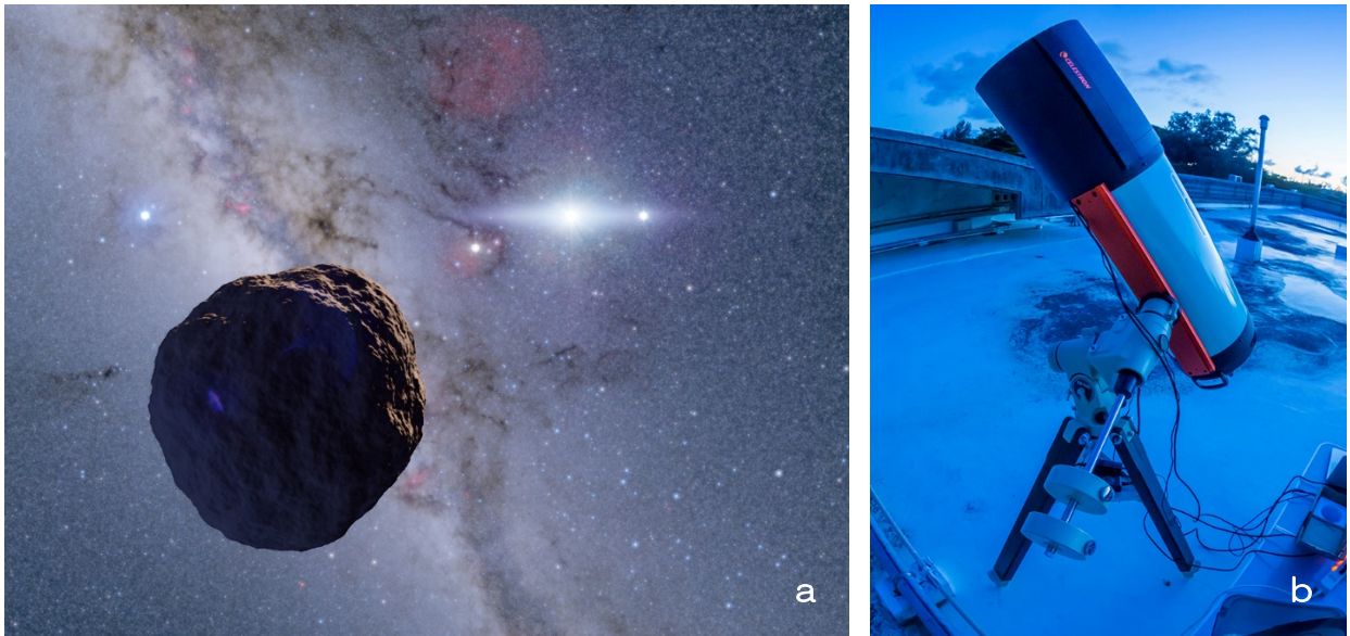
【図1】 (a) 本研究によって史上初めて発見された、微惑星の生き残りとして推定される半径約 1.3km の小型カイパーベルト天体の想像図。(b) 巨大望遠鏡でも直接観測不可能な小型カイパーベルト天体が発見した宮古島の口径 28cm 小型望遠鏡 (OASES 観測システム)