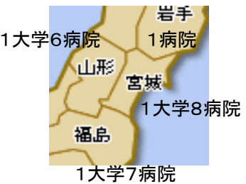
図3 東北がんプロフェッショナル養成プランの組織概要