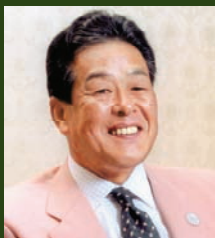
村田 兆治 むらた ちょうじ プロ野球解説者・元プロ野球選手 1949年広島県生まれ。1967年ドラフト1位で東京オリオンズ（現・ロッテ）入団。23年間で215勝、数々のタイトルを獲得。野球評論家、講演や野球教室でも活躍中。