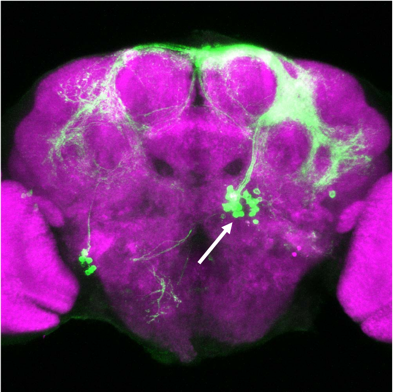
図 キイロショウジョウバエ雄の脳の片側に染めだされた P1 細胞群（矢印）とその神経突起