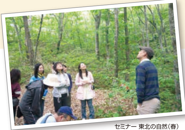
セミナー 東北の自然(春)