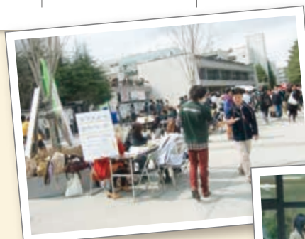
平成24年新入生歓迎会