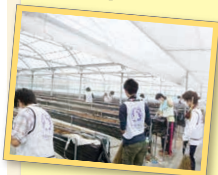
山元町のいちご農園ボランティア

このほかにも、震災に関するボランティアや復興に関心のある学生のために「震災ボランティアスタートアップフェア」などが行われます。