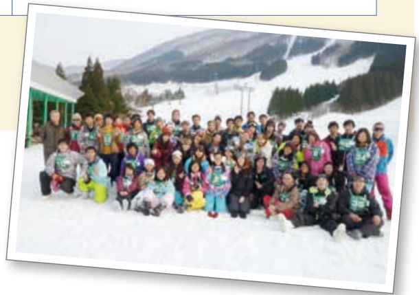
留学生と日本学生との集い