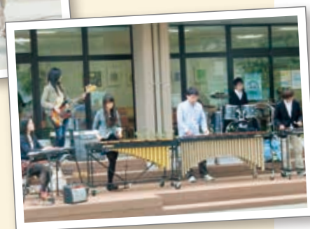
文化フェスティバル