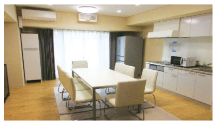
(オープンリビング写真)