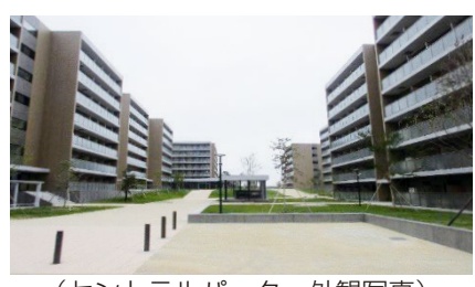
(セントラルパーク・外観写真)