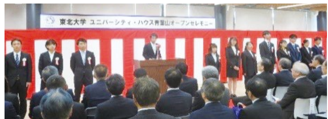
(オープンセレモニー テープカット/入居者代表挨拶)