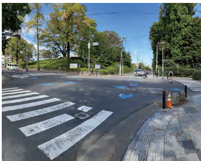
▲仙台二高前の交差点

「歩行者専用現示方式」は、すべての方向の自動車等を同時に停止させている間にすべての方向の歩行者等を同時に横断させる方式であって、斜め方向の横断を認めないものをいいます。また、自転車が歩行者用信号に従って横断する際にも、自転車から降りて横断してください。これからも東北大生としての責任を自覚し、交通ルールをしっかりと守って、安全に利用しましょう。