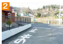
2 保育園の玄関付近では、園児の安全確保のため、十分注意して通行しましょう。