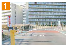
1 遊歩道との交差点です。必ず一時停止を行いましう。

また、次の5箇所は歩行者や自動車との接触など危険箇所なので、通行するときに十分注意しましょう。