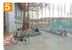
5 体育館利用者の通行のため、体育館玄関前には駐輪しないようにしましょう。