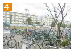
4 キャンパスの出入口通路にはみ出して駐輪しないで下さい。満車の際は空いている他の駐輪場を利用しましょう。