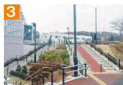
3 市道から駐輪場へは、階段中央のスロープを利用し自転車を引き上げて下下さい。降りる際も必ず自転車を引いて利用して下さい。