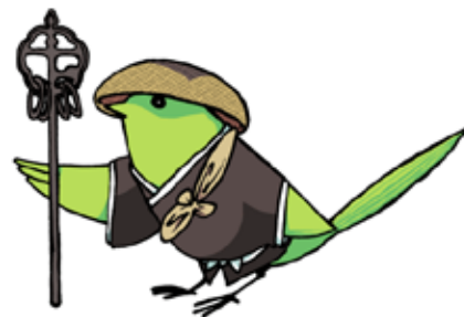
大会公式マスコット 「ホケキョ坊」